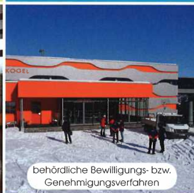
behördliche Bewilligungs- bzw. Genehmigungsverfahren