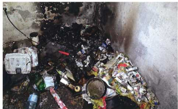
Brand in einem Wohnhaus mit Todesfolge Brandursache: eingeschaltete Herdplatte