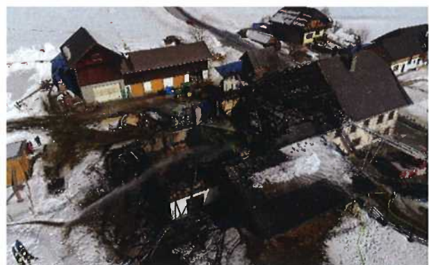
Brand einer Landwirtschaft Brandursache: elektrischer Defekt Brechmühle