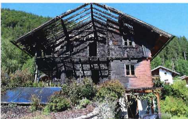
Brand in einem Einfamilienwohnhaus Brandursache: elektrischer Defekt Wasserkocher