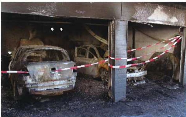
Garagenbrand Brandursache: technischer Defekt KFZ