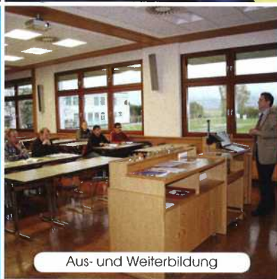
Aus- und Weiterbildung